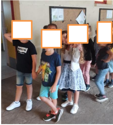
Sous le petit préau