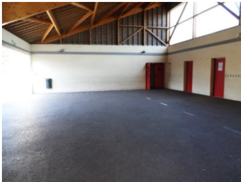
Le grand préau qui mène aux classes de CE2,CM1 et CM2