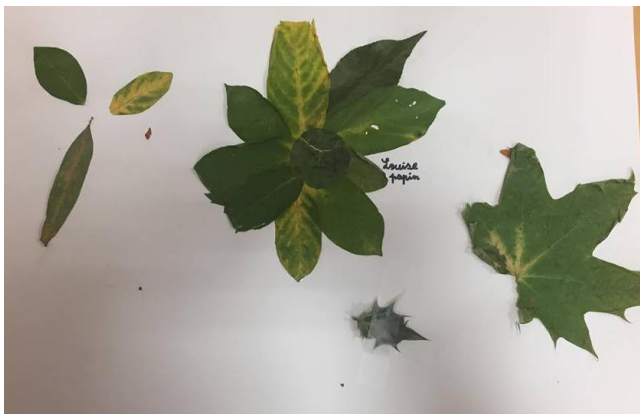
« Mon œuvre s'appelle le chien piquant et les trois feuilles représentent les niches du chien piquant. » Louise