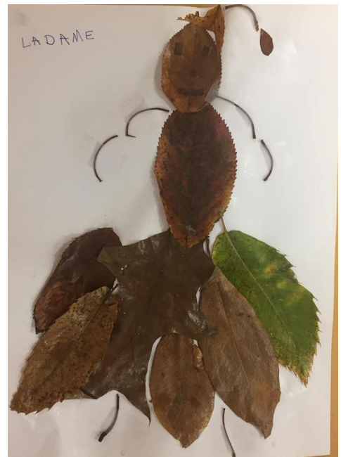
La dame aux feuilles