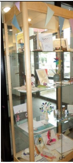
la vitrine de l'écrivain